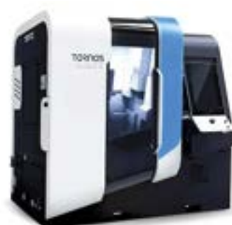
1 CNC TORNOS EvoDECO 32 (10-32mm)