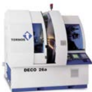
5 CNC TORNOS DECO 26 (10-32mm)