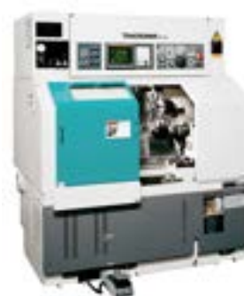
1 CNC TAKISAWA (20-75mm)