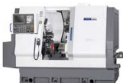
1 CNC MIYANO BNE51SY (10-51mm)