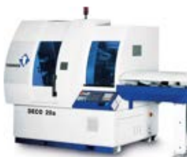
7 CNC TORNOS DECO 20 (5-22mm)