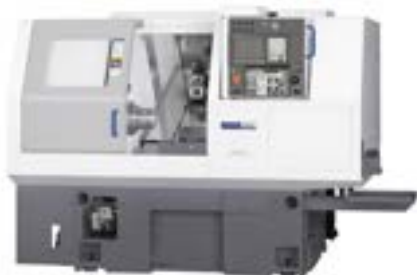
1 CNC MIYANO BND51S2 (10-51mm)